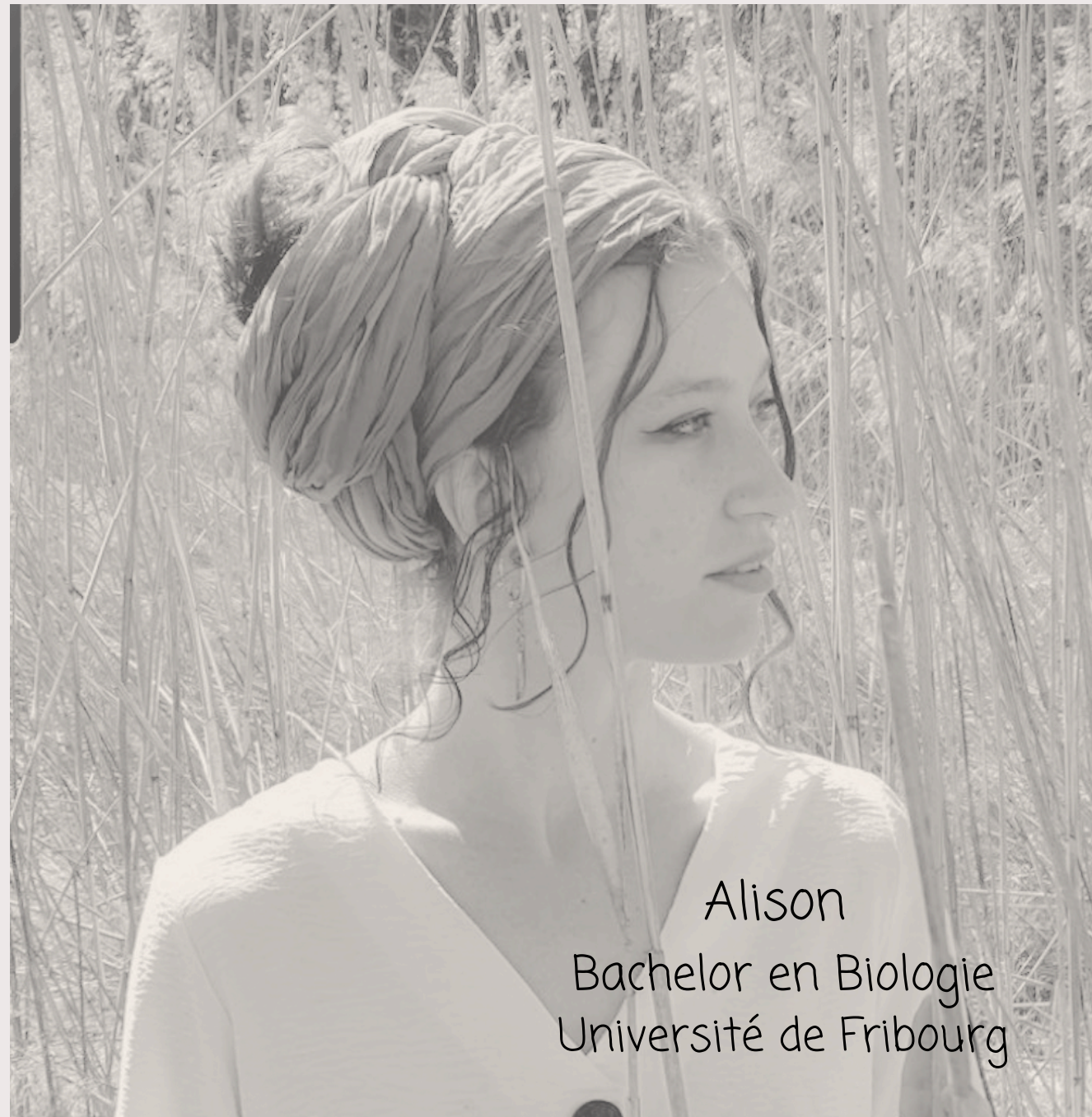
Alison Bachelor en Biologie Université de Fribourg